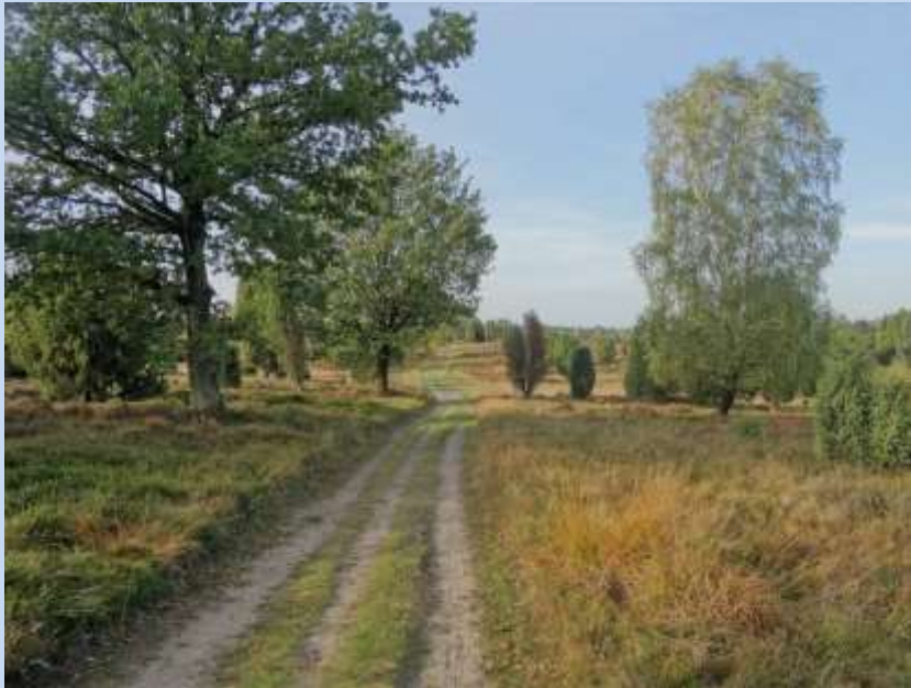
vor dem Wilseder Berg...