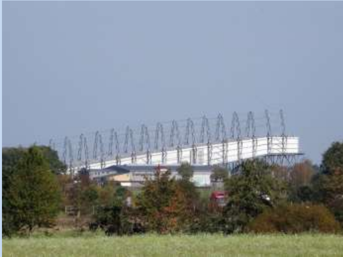
Skifahren im Sommer