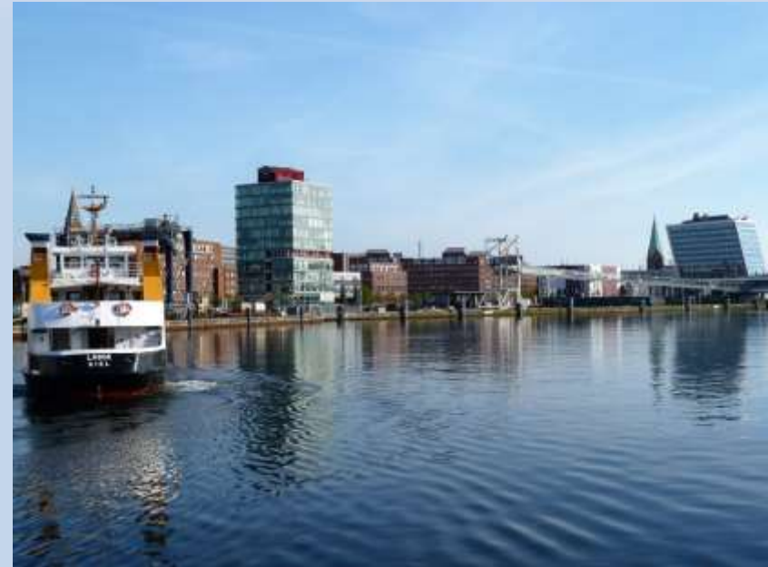
Blick aus der DJH-Kiel