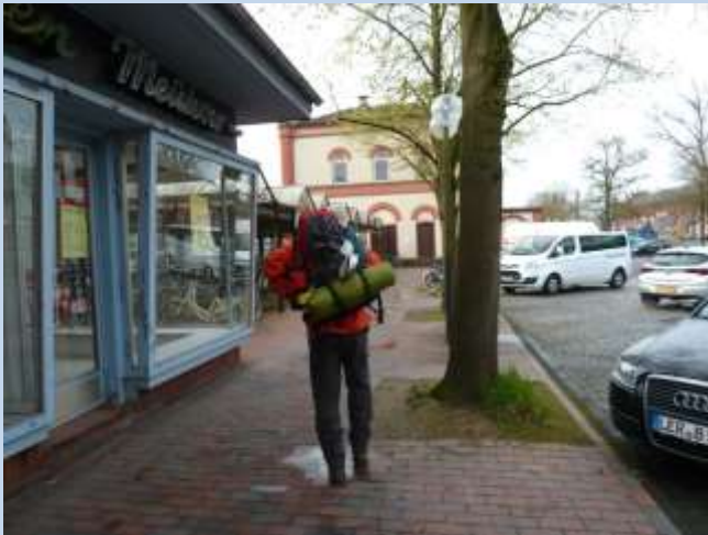
Vor dem Leeraner Bahnhof